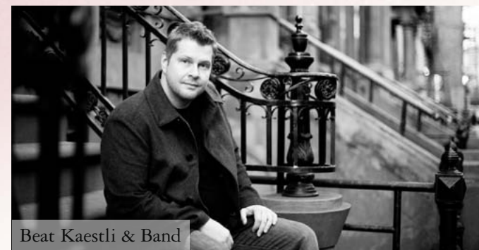
Beat Kaestli & Band

Der Schweizer Beat Kaestli ist Sänger, Songwriter, Produzent und Arrangeur. Sein Musik-Studium zog er an der renommierten Manhattan School of Music durch, schloss seinen Master 2008 am Queens College mit dem