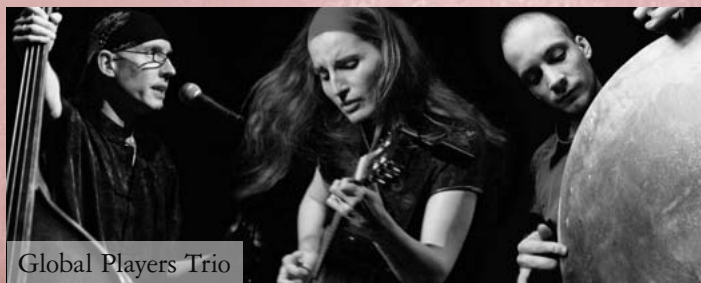
Global Players Trio